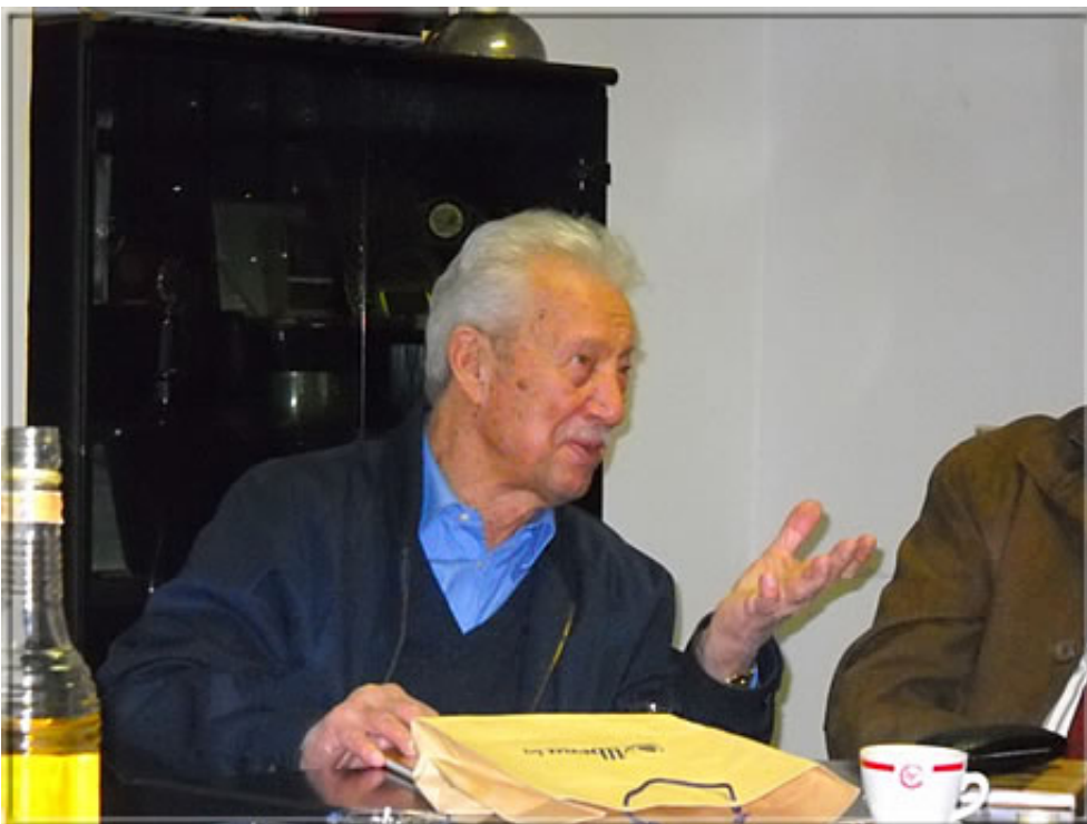
GM Svetozar Gligorić