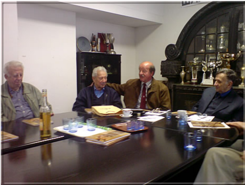
Svetozar Gligorić im Bild.