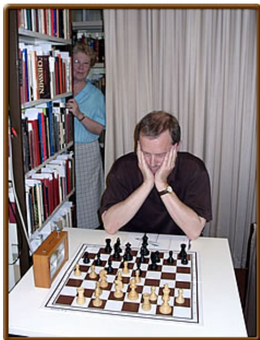
Weder der "gute Geist" im Hintergrund noch die massive Schachbuch-Front von der Seite konnten Wolfgang Pähz "retten".

Der bekannte internationale Meister Bernd Schneider aus Solingen (aktuelle FIDE-ELO 2427) war bereit, an 12 Brettern eine Uhrensimultan-Vorstellung zu geben (90/90) - sicherlich eine durchaus anspruchsvolle Herausforderung. Wie mir Bernd später berichtete, war die Spielstärke der Teilnehmer schon fast etwas zu hoch, doch trotz einiger wackeliger Stellungen gelang es dem Meister, ein beachtliches 9,5 - 2,5 zu erzielen.