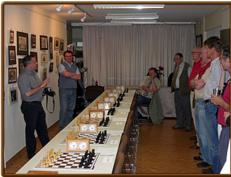
Instruktionen zum Start - ein Uhrens simultan