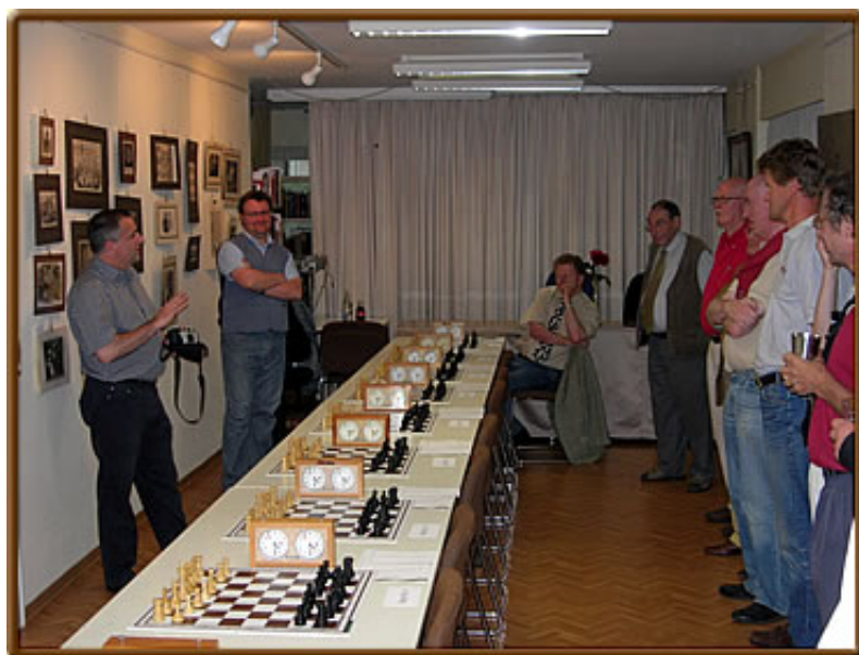
Instruktionen zum Start - ein Uhrensimultan