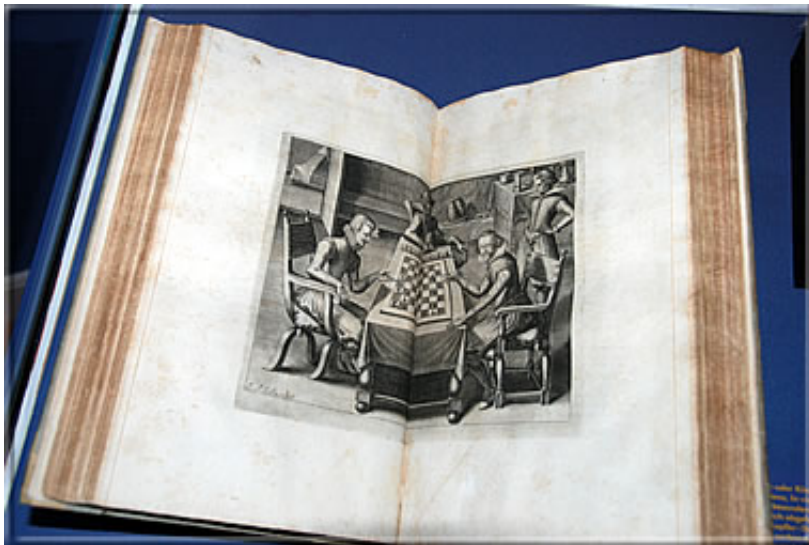
... die sich im "SELENUS" an zentraler Stelle wiederfindet.

Interessanterweise enthält der Titelkupferstich des "Selenus" eine Reihe allegorischer Darstellungen mit Motiven aus der altgriechischen Mythologie, als "Stichworte" seien nur Palamedes, Odysseus und der Trojanische Krieg erwähnt. Im unteren Teil des Titelblatts tritt der Herzog als Kolumbus auf, der in eine Diskussion mit spanischen Edelleuten verstrickt ist, sogar das "Ei des Kolumbus" feiert fröhliche Urständ. Eine ausführliche Darstellung können wir an dieser Stelle nicht geben, aber der Wissensdurstige erfährt wesentlich mehr auf dieser Webseite der Lippischen Landesbibliothek Detmold: 'Schach dem Herzog!'