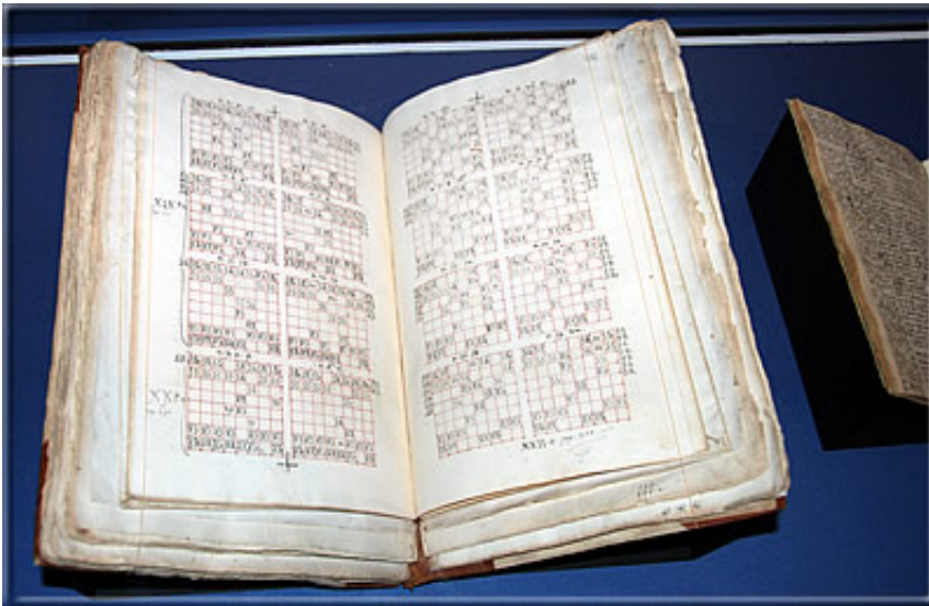
Die Aufnahme von Diagrammen (damals mit Buchstaben "symbolen" für die Figuren) erhöhte merklich die Attraktivität des Buchs, aber zugleich dessen Herstellkosten.

Am frühen Abend konnte unsere Jubiläumsfeier programmgemäß im Auktionsaal eröffnet werden, denn auch unser (zu diesem Zeitpunkt noch) deutscher Länder-Repräsentant Michael Negele war rechtzeitig aus Wuppertal eingetroffen.