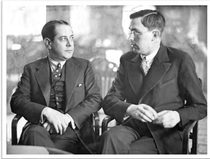
CAPABLANCA EN EUWE TE AMSTERDAM 1931

Ook de scores tegen de derde wereldkampioen José Raul Capablanca zijn in het nadeel van Euwe. Euwe wist in tegenstelling tot Lasker, Capablanca echter wel verslaan tijdens het AVRO toernooi in 1938, maar na achttien partijen was de eindscore 10\frac{1}{2} - 7\frac{1}{2} in het voordeel van Capablanca.