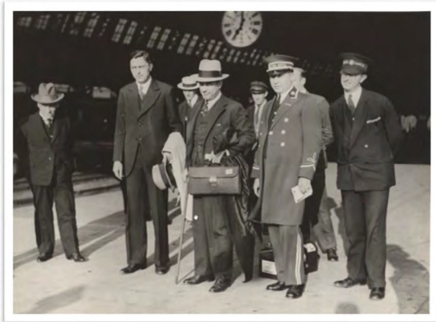
CAPABLANCA WORDT DOOR EUWE EN VAN TROTSENBURG (L) VERWELKOMD DOOR EUWE OP HET CENTRAAL STATION VAN AMSTERDAM

Hierna volgden nog twee remises, in 1934 in Hastings en 1936 in Nottingham totdat de heren elkaar voor het laatst treffen op het AVRO-toernooi in 1938. In de zevende ronde wint Capablanca maar wit maar in de 14 e ronde weet Euwe Capablanca uiteindelijk te verslaan.