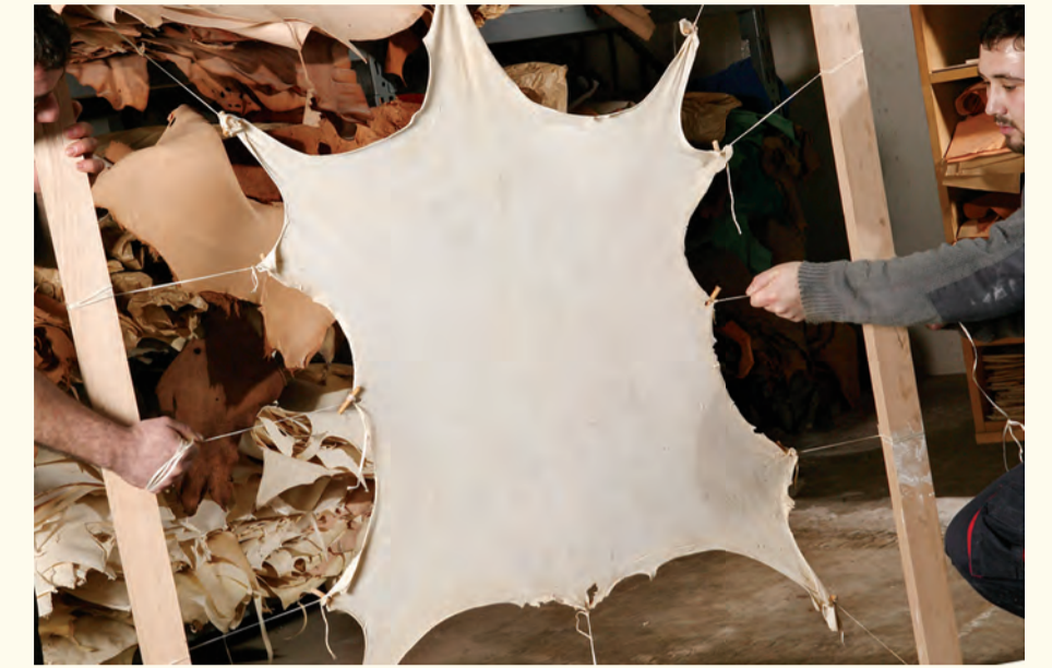
Secado y tensado sobre bastidor de madera. Drying and stretching on wooden frames.

After tens of centuries since its use as a way of writing and transmitting knowledge, Scriptorium, thanks to the completion of the 390 copies of the Alfonsine manuscript on this extraordinary and genuine natural parchment, allows us to feel through its beautiful miniatures drawn with fine paintbrushes, and through its natural touch and smell, the emotion of holding the testimony of an old and wise work that illuminators and amanuenses left us patiently in vellum and parchment.