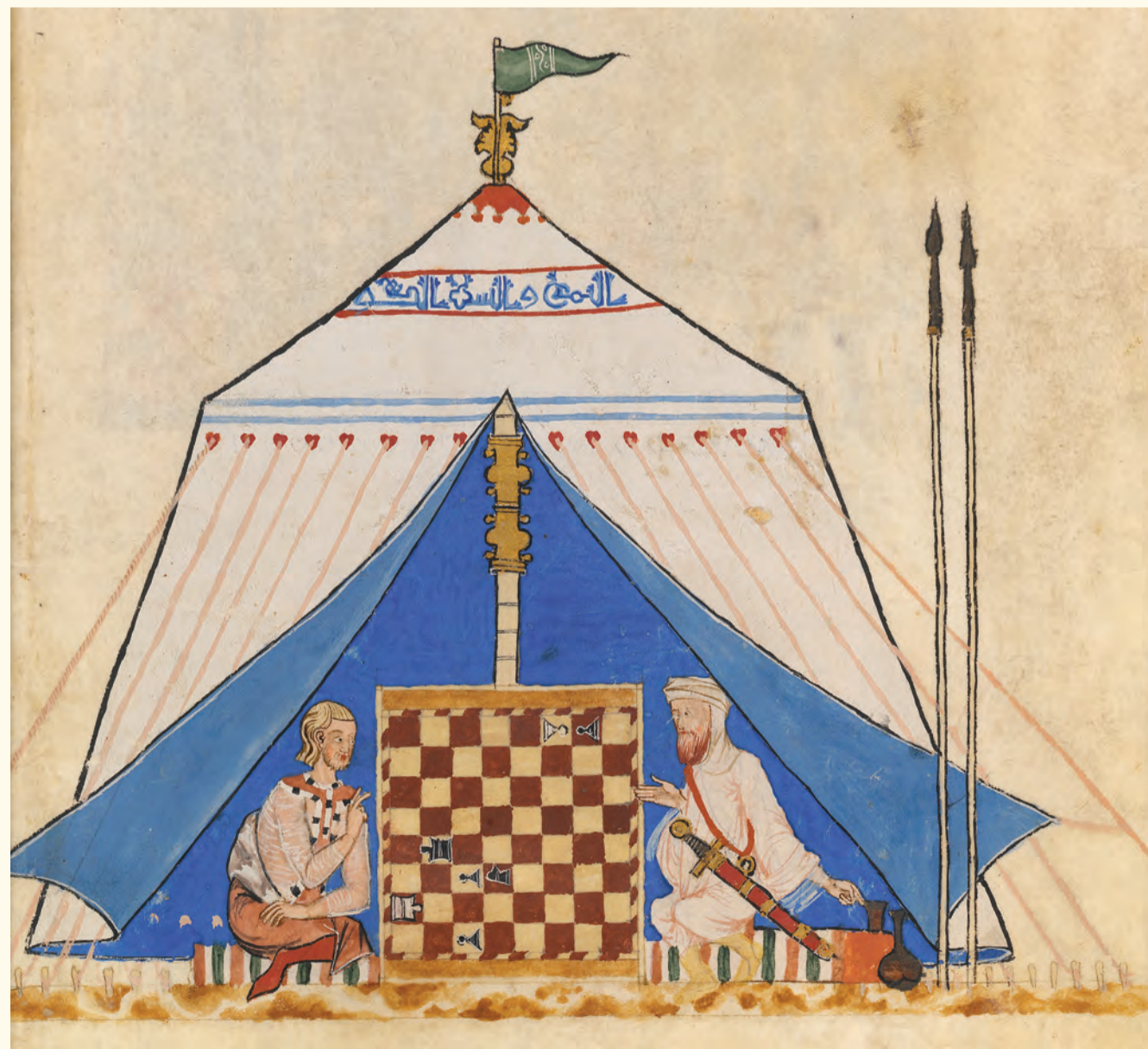
Jugadores de frontera, jugando en el interior de una tienda de campaña (folio 64 r). Border players at the game inside a tent (folio 64 r).

(Folios 47 v y 48 r, páginas centrales del catálogo)