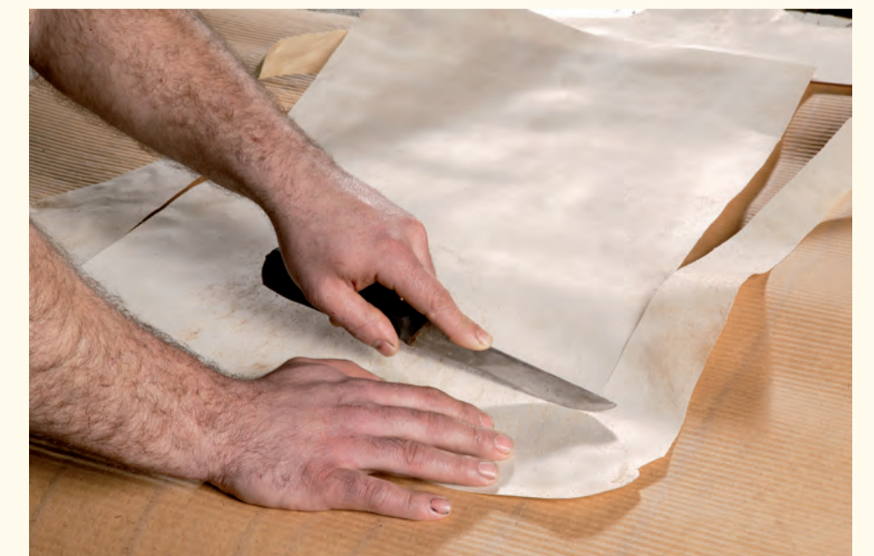
Taraceado manual al tamaño del manuscrito original. Manual marquetry in the same size as the original manuscript.