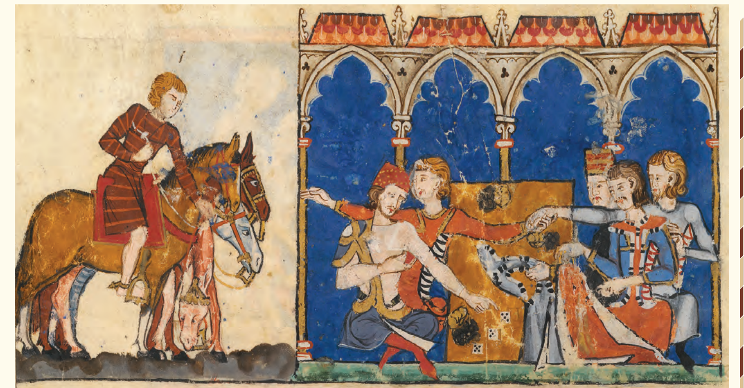
Hermoso ejemplo del naturalismo animal, habitual en las representaciones alfonsies (folio 67 v). A beautiful example of animal naturalism, quite common in Alfonsine representations (folio 67 v).

he had a baby with her before his marriage. And, on the other hand, the erotic and stark love represented in folio 48r, where the King appears in his maturity; despite not being playing, he is looking at two women who appear, dressed with low-cut and transparent clothes, from either sides of the board. Alfonso raises his hand and points at the board. Censors have rubbed the ladies' cleavage and the results are even more misleading, as it looks like Alfonso had been touching the breast of the player next to him