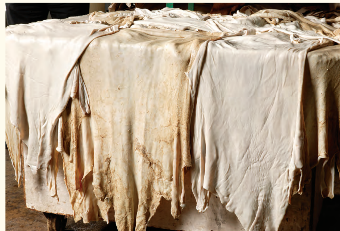
Presecado y escurrido natural.

Transcurridos decenas de siglos desde su utilización como medio de escritura y transmisor del saber, Scriptorium con la realización de las 390 copias del códice Alfonsí sobre este extraordinario y genuino soporte de pergamino natural, nos permite sentir a través de sus bellas miniaturas trazadas con finos pinceles, su tacto y olor natural, la emoción de tener en las manos el testimonio de la antigua y sabia labor que durante siglos, iluminadores y amanuenses con su paciente saber nos legaron en vitelas y pergaminos.