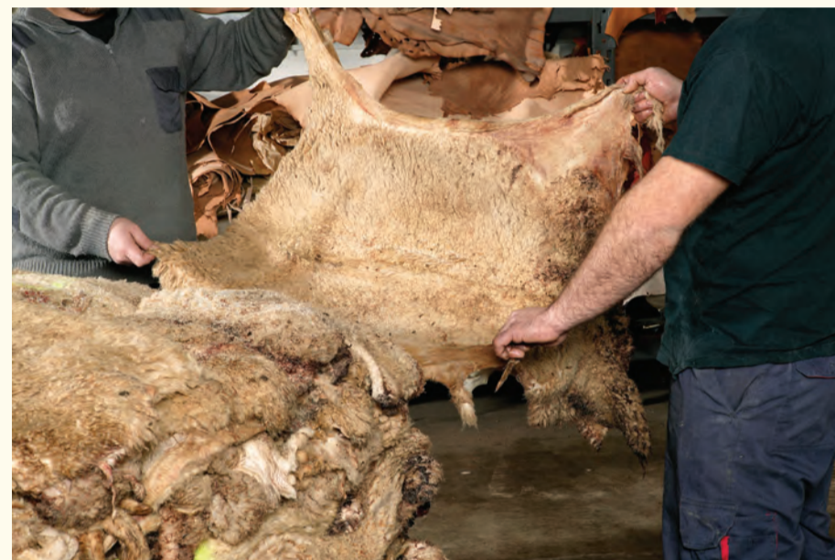
Selección de las pieles una por una. Selection of skins, one by one.