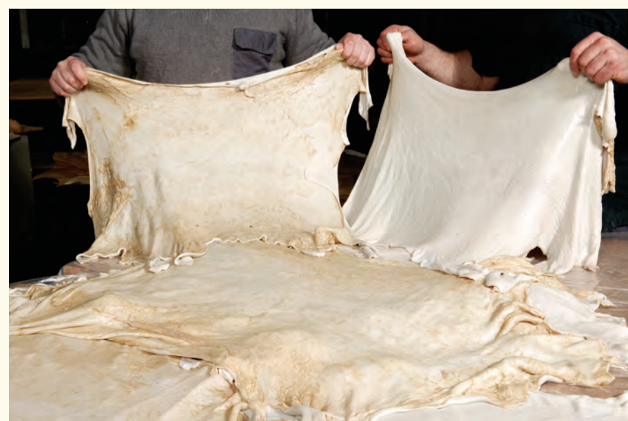
Aspecto de la piel después de la maceración con agua y cal. Skin appearance after having been soaked in water and lime.

El pergamino es un soporte de escritura cuya obtención conlleva un proceso de elaboración dilatado y costoso, puesto que la piel del animal a partir de la cual se elabora, generalmente cordero, cabra, oveja o carnero, debe tratarse de forma específica para convertirla en una materia útil y perdurable.