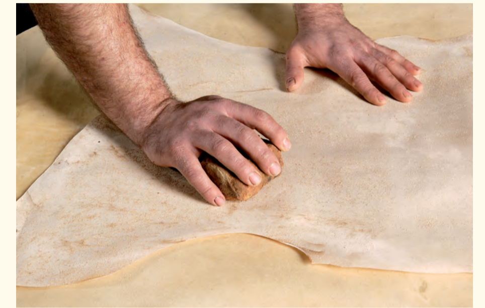
Pulido y alisado manual por ambas caras. Manual polishing and smoothing in both sides.