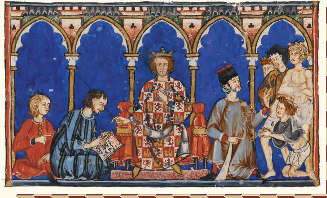
Miniatura en la que se representa al Rey enfrascado en su labor intelectual ( folio 65 r ). Miniature which represents the King buried in his intellectual work (folio 65 r).

Hijo primogénito de Fernando III, a quien sucedió en 1252, ya como infante conquistó el reino de Murcia (1241). En 1246, contrajo matrimonio con doña Violante de Aragón, hija de Jaime I el Conquistador. Reanudó la ofensiva contra los musulmanes tomando plazas como Jerez, Lebrija, Niebla y Cádiz. En 1264 tuvo que hacer frente a una importante revuelta de los mudéjares de Murcia y el valle del Guadalquivir.