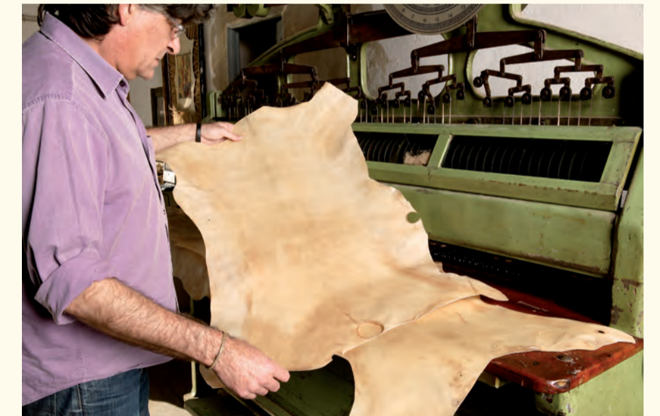
Comprobación del resultado final del proceso. Check of the final result.