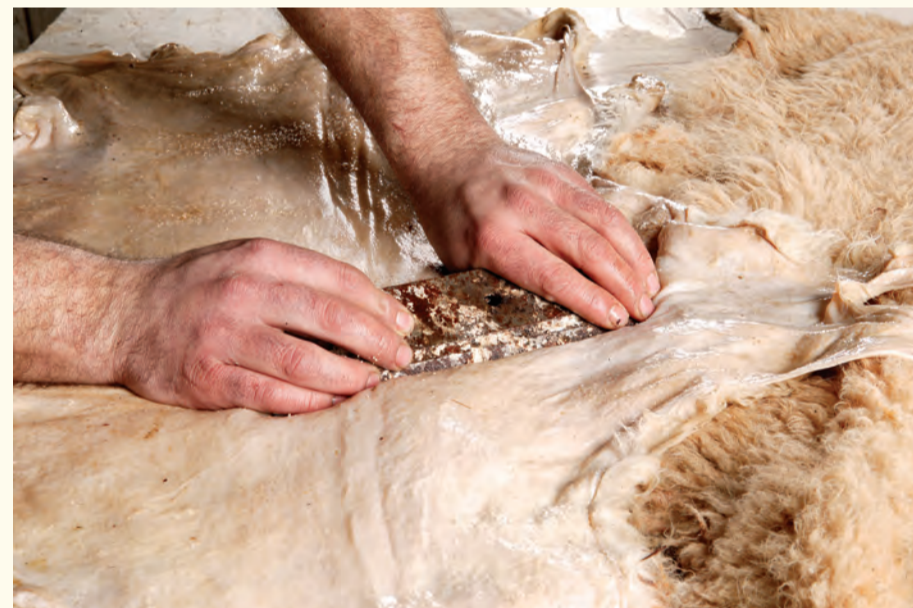
Descarnando de la piel de forma manual. Manual skin scraping.