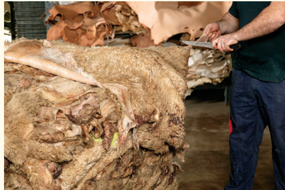
Saneamiento de las pieles. Skin cleaning.