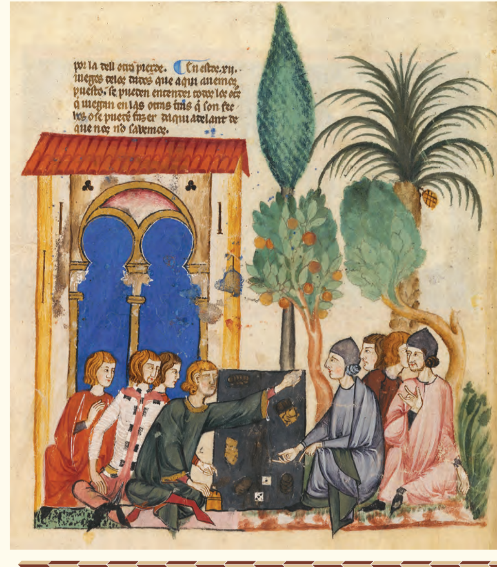
Una de las miniaturas más bellas: jugadores de dados en jardín sevillano (folio 71 v). One of the most beautiful miniatures: dice players in a Sevillan garden (folio 71 v).

The drawings placed under arcades are only a few, and enclosed in a plain frame are the most frequent. Sometimes a character in the scene appears out of the frame as in folio 67v, where a servant who holds the bridle of three spirited dice players' horses embodies a beautiful example of animal naturalism, as usual in Alfonso X's representations, which is highlighted because of being outside the frame.