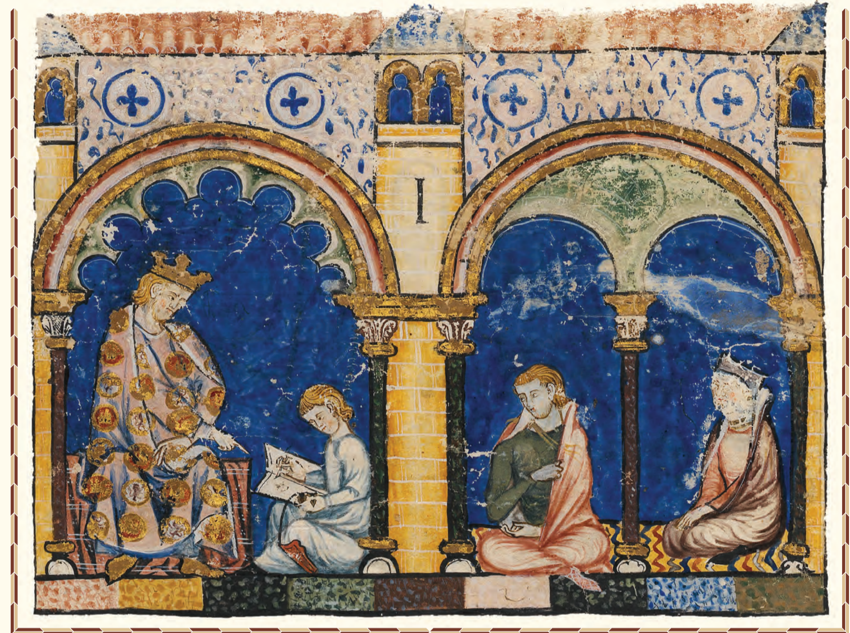
En ésta iluminación el Rey aparece dictando a un escriba en presencia de otros dos personajes que podrían ser ajedrecistas de su corte encargados de la labor de compilación (folio 1 r). In this miniature the King appears dictating to a scribe in front of two other characters that might be chess players of his court who compiled information (folio 1 r).

Alfonso X the Wise is considered to be the founder of the Castilian prose; in fact he carried out the first Castilian spelling reform. The Castilian language was first considered as the state language during his reign, to the detriment of latin, and it was expanded all over the world. From his wide literary work, the "Book of Chess, Dice and Boards Games" is the Alphonsine codex that gives us more details about his development, as we can confirm in the final paragraph which reads: