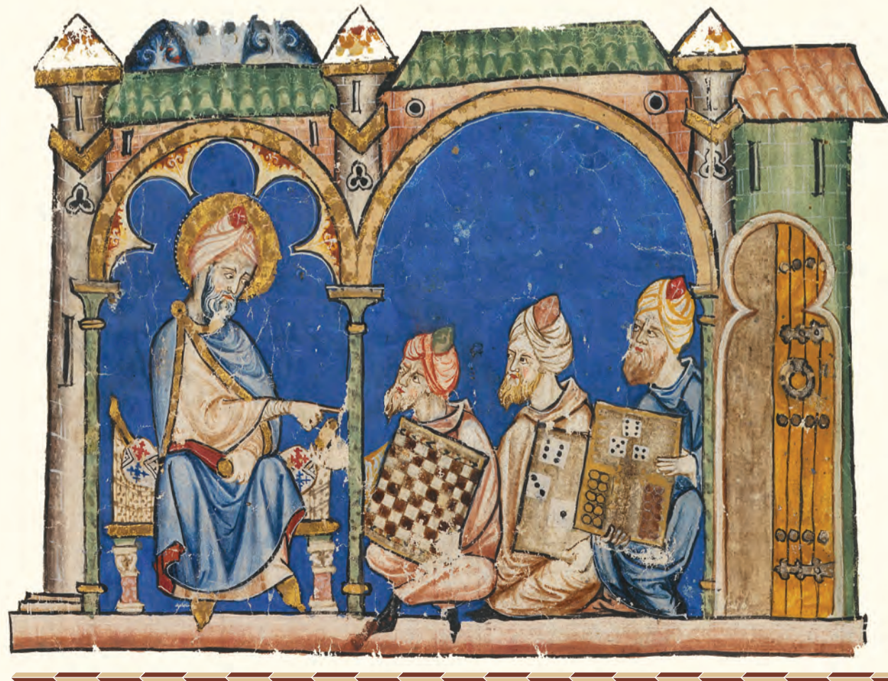
... "E por que el acedrex es mas asssegado iuego e onrrado que los dados nin las tablas fabla en este libro primeramente del "... (folio 2 v).

Al final de su vida, en un momento de aparente derrota en todas sus empresas, el Rey Sabio hubo de reflexionar sobre el dilema basado en una leyenda de la India que se lee en los comienzos del "Libro de los Juegos de Ajedrez, Dados y Tablas", en el folio 2r, y que plantea que es más conveniente para la vida, para el reinado, para el tablero de juegos, si la sabiduría o el azar, y quizá, al ser consciente de que la sabiduría ("el seso") no había sido suficiente para proporcionarle sosiego, hubo de aceptar que en la vida tanto de los reyes como de los pueblos, el azar es un factor decisivo.