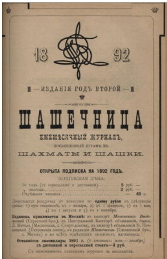
Shashechnitsa, advert for proposed volume 2

The magazine's title proved misleading to the public and after six months the journal was renamed Shakhmatnoe Obozrenie (Chess Review) and continued with the same numbering - see next item.