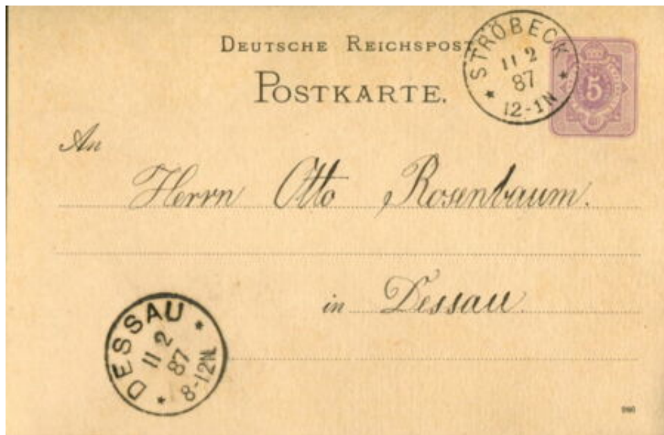
Postcard of February 11, 1887 - Sent on February 11 from the Ströbeck post office with a receipt stamp of February 11 from the Dessau post office

Siegfried Schönle (Kassel) / February 2023