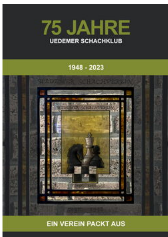
75 Jahre Uedemer Schachklub - frontcover

– Ein Verein packt aus – [A club unpacks]