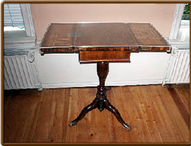
Der Spieltisch im Lessinghaus

beim Schachspiel. Lessing schaut zu. (Gemälde von Moritz Daniel Oppenheim, 1856)