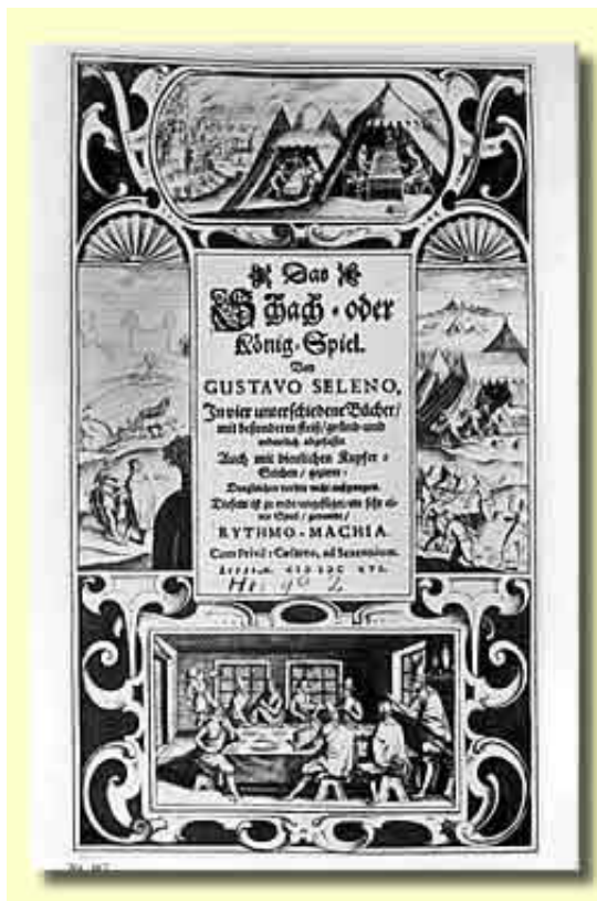
Titelblatt des Schachbuches von Herzog August