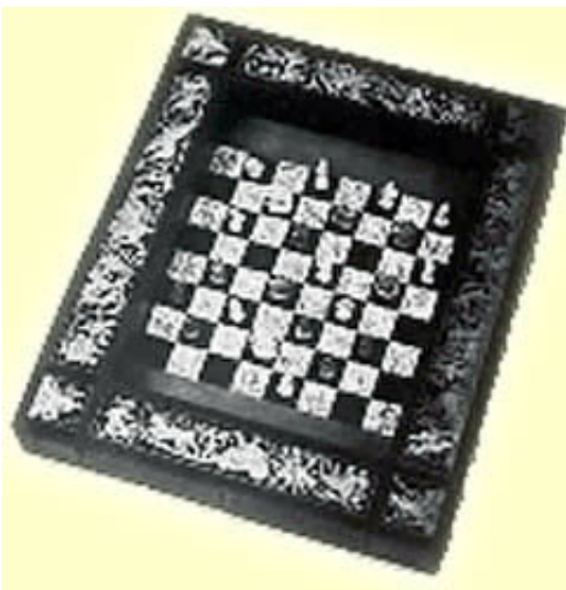
Schachspiel von Herzog August (Braunschweig, Anton-