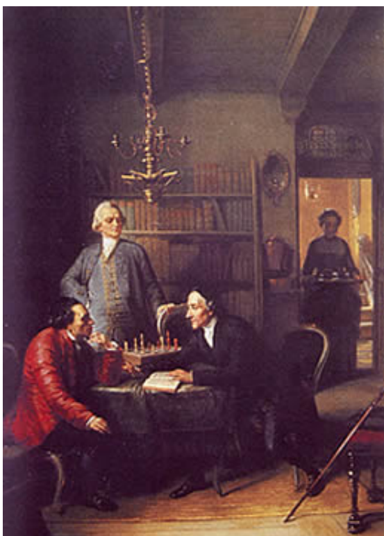
Moses Mendelssohn (links) und Johann Kaspar Lavater