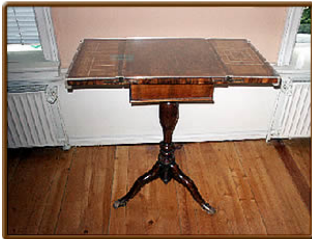
Der Spieltisch im Lessinghaus

beim Schachspiel. Lessing schaut zu. (Gemälde von Moritz Daniel Oppenheim, 1856)