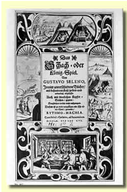
Titelblatt des Schachbuches von Herzog August