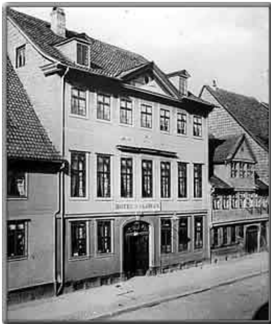
Gaststätte "Zum Löwen" um 1870 in der Breiten