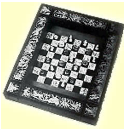
Schachspiel von Herzog August (Braunschweig, Anton-