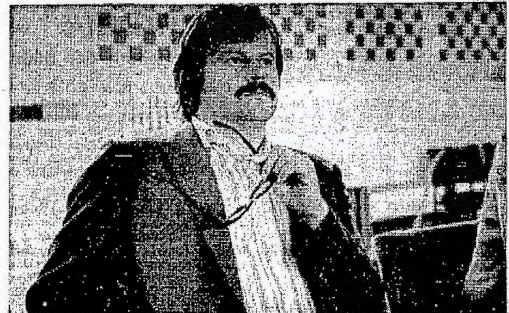
Großmeister Vlastimil Hort mit „Konzentrationsbrille“ vor seiner denkwürdigen Meraner Vorstellung. Mit fast elf Stunden Dauer wird diese Veranstaltung vielleicht ebenso in die Schachgeschichte eingehen wie die „Meraner Variante“, die bei einem Turnier in den zwanziger Jahren erfunden wurde.

Am späten Abend flammten gestern auf den Höhen über Lichtenberg Bergfeuer auf, da die alte Tradition der Herz-Jesu-Feuer dort um vorigen Sonntag durch den Regen buchstäblich „ins Wasser gefallen“ war.