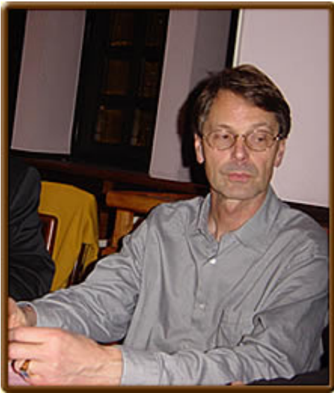
— Autor Siegfried Schönle