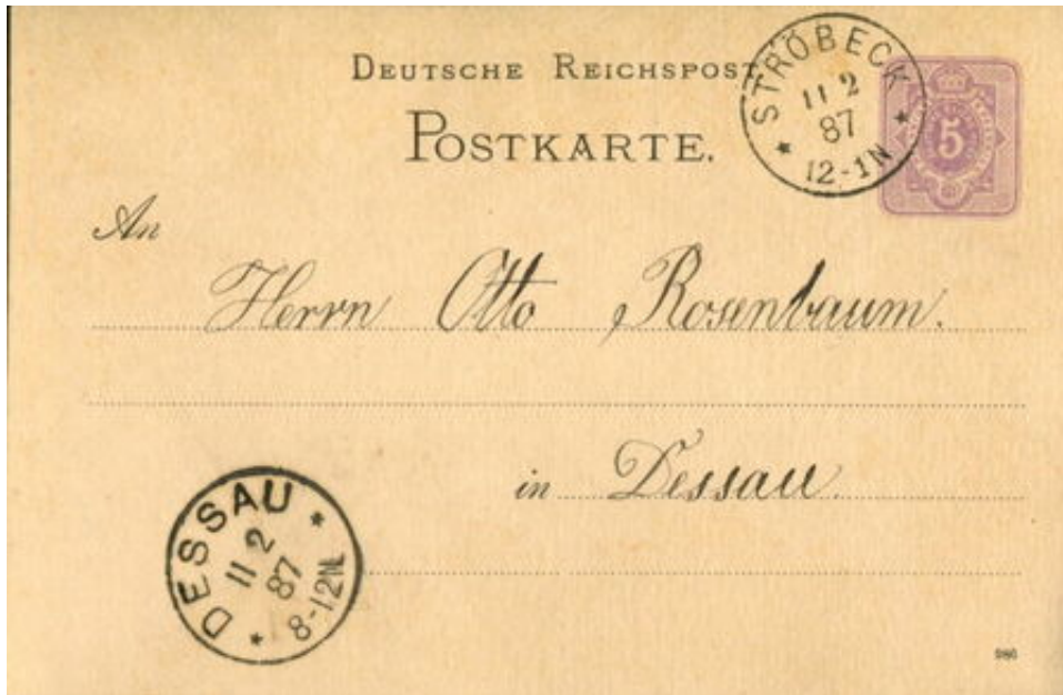
Postkarte vom 11. Februar 1887 - Abgeschickt am 11. Februar vom Postamt Ströbeck mit Eingangsstempel vom 11. Februar des Postamtes Dessau

unterschiedliche Handschriften zu erkennen sind. Vielleicht lässt sich dieses Mysterium irgendwann auch noch auflösen.